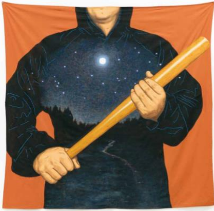
오늘 밤 많은 것이 결정된다, 2017, 천 위에 아크릴릭 과슈, 젯소, 210x210cm