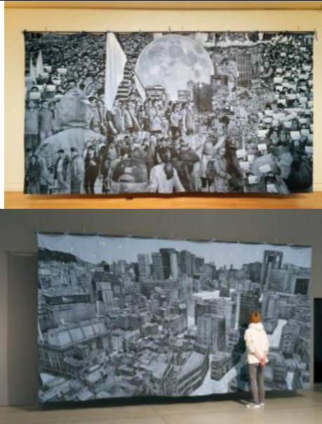
빛나는, 거리 위의 사람들 , 2016, 천 위에 수성 페인트, 젯소, 300x543cm(x2)

빛나는, 거리 위의 사람들 (2016)은 두 개의 천으로 구성된 대형 작품이다. 종로를 광장으로 가는 연결 통로라고 생각하고 그린 작품이다. 여기서 광장은 단순히 광화문 광장에 한하는 것이 아니라 시민 사회의 중심이 되는 장소를 의미한다. 하나의 천에는 근거리에서 바라본 인물이 가득하고 다른 하나의 천에는 멀리서 바라본 건물과 불빛이 가득하다. 주관적 객관적 목격자의 역할을 동시에 취하고자 하는 작가의 시도가 보인다.