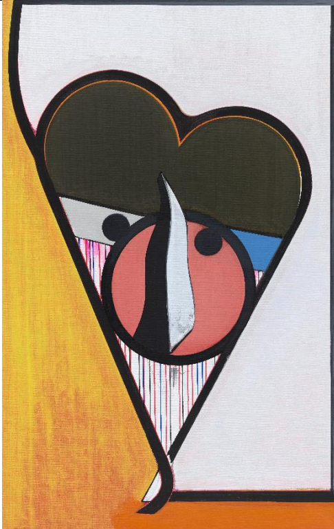
AUF의 초상 , 2018, 캔버스에 유채, 비닐, 피그먼트 마커, 140x90cm

이미지와 전시 서문 인용 시 각 작가와 저자의 저작권 표기 부탁드립니다.