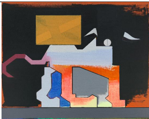
파스빈더의 초상, 2019, 캔버스에 유채, 비닐, 피그먼트 마커, 150x190cm

© Thomas Scheibitz / VG Bild-Kunst, Bonn 2019