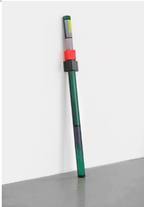
캐피탈 VI , 2019, 판, 판지 마운팅, 비닐과 아크릴릭, 247x11.5cm

캔버스 위에 뚜렷하게 보이는 하트 모양 기호가 인상적인 작품이다. 이 작품은 작가 친구들이 조성한 밴드 'AUF'를 위해 디자인했던 앨범 커버와 관련이 있다. 해당 앨범 커버는 파기되었다고 한다.