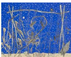
별을 보여드립니다 - 호박

차를 운전하다 굽은 길을 만나면 속도를 줄이고 반사경을 살피게 된다. 지나온 길을 돌아보는 순간이다. 비로소 주위에 '느린 풍경'이 펼쳐진다. 새로운 각도와 반경의 세계다. 삶에도 이러한 순간이 필요하다. 가끔 속도를 줄이거나 멈추어 서야 지나칠 뻔한 풍경을 발견할 수 있다. 직진을 방해하는 신호를 만나야 쉬어갈 수 있고, 원래의 자신으로 돌아갈 수 있다.