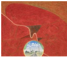
느린 풍경 - 덕도길

작품 하단에 월요일부터 일요일을 뜻하는 알파벳을 나란히 적고, 그 위에는 매일의 일정을 흐릿한 글씨로 새겼다. 세 달여의 삶을 쓰고 지운 흔적이 먼지나 구름처럼 뿌영다. 세월에 따라 사라지고 잊히는 매일의 삶, 순간의 아름다움을 화폭에 기록해 기억하고자 했다.